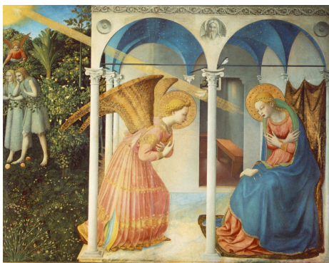
La Anunciación, fFra Angélico, 1438-45

Supuestamente Fra Angélico hizo una declaración durante su vida que puede considerada como profunda reflexión de corresponsabilidad: "Aquel que hace el trabajo de Cristo, debe estar siempre con Cristo."